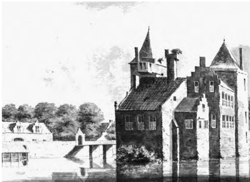
Huis Amerongen anno 1646

enkele bescherming meer boden. Niemand maakte zich daarover zorgen, het nut van het kasteel lag op een ander vlak. Wie toegang wilde hebben tot de ridderschap van Utrecht moest naast een riddermatige afkomst en een stevig financieel vermogen in het bezit zijn van een erkende hofstede. In Utrecht stonden drieënzestig hofsteden, Huis